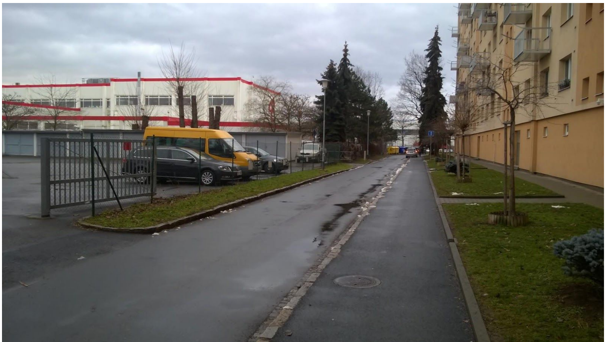
Pohled na komunikaci, „chodník“ pro parkování a chodník podél domu