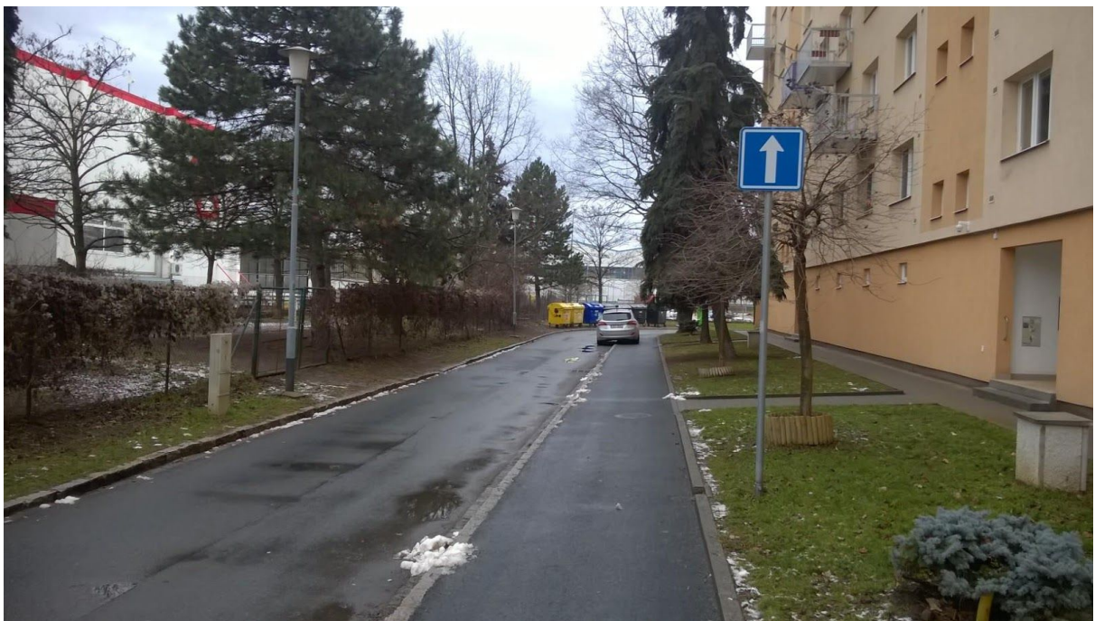
Pohled na komunikaci, „chodník“ pro parkování a chodník podél domu